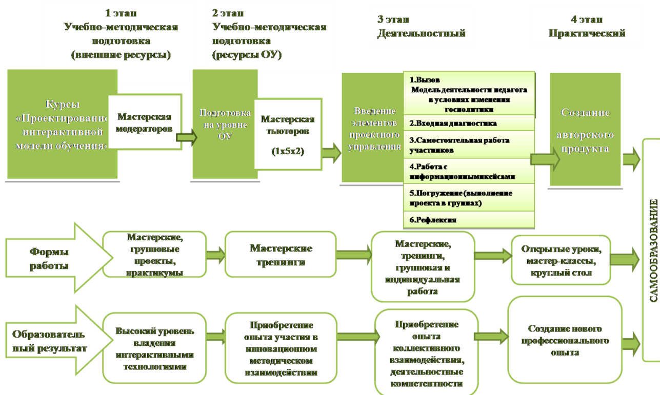
Рисунок 3 Схема реализации модели ВКПКП

Представленная схема, демонстрирует четыре основных этапа обучения: первые два – учебно-методическая подготовка. Первый этап – курсы повышения квалификации по теме обучения (в модели - внешние ресурсы); второй этап – подготовка на уровне образовательного учреждения (внутренние ресурсы). Третий этап – деятельностный, включающий систему мероприятий ВКПКП. Данному этапу предшествует входная диагностика, позволяющая педагогам получить достоверное представление о дефицитах в профессиональной подготовке. На основе полученных данных происходит дифференциация деятельности (формируются группы педагогов: выделяются явные лидеры; творческие группы, работающие по конкретному направлению в опережающем режиме; группа педагогов, самообразовательная деятельность которых выполняется при поддержке педагогов – лидеров, модераторов и тьюторов).