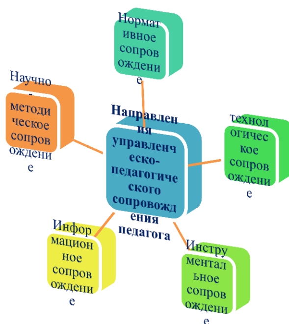
Рис.1. Направления управленческо-педагогического сопровождения педагога в условиях реализации модели внутрикорпоративного повышения квалификации.

Вышеперечисленные проблемы актуальны и для нашего образовательного учреждения, что и послужило основанием для разработки модели внутрикорпоративного повышения квалификации педагогов для повышения их профессиональной компетентности, подготовки к работе в соответствии с требованиями новых стандартов. В целях формирования новых компетенций учителя в МБОУ «СШ №43» разработаны концептуальные подходы и принципы деятельности методической службы по организации внутрикорпоративного повышения квалификации кадров. Выявлены основные направления реализации управленческо-педагогического сопровождения педагога (См рис1.).