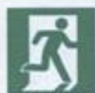
E 01-02 Выход здесь